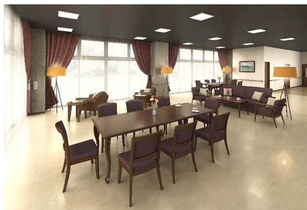
&lt;コミュニティラウンジ(イメージ)&gt;