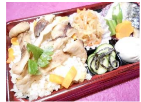
「イベント食イメージ(松茸ごはん)」