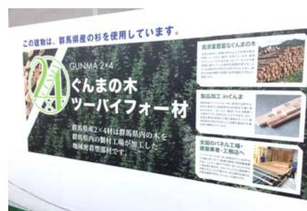
仮囲いのラッピングイメージ

※1 仮囲い:工事現場内外の安全確保のため、一定期間(3カ月～1年程度)現場周囲に設ける囲いのこと