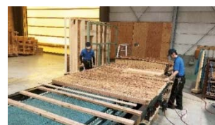
県内JAS認定工場での製材