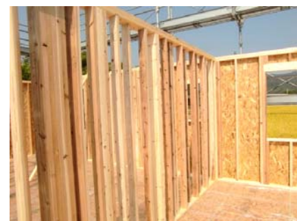
国産材を活用した建築現場 (2016年8月撮影/熊本県)

当社は今後も、木材の地産地消推進による地域経済の活性化を図るとともに、多くの木材を調達・使用する事業者として、国内の森林サイクルへ積極的に関与し、生物多様性からの恵みである木(森林)への影響を意識した木材調達を推進します。