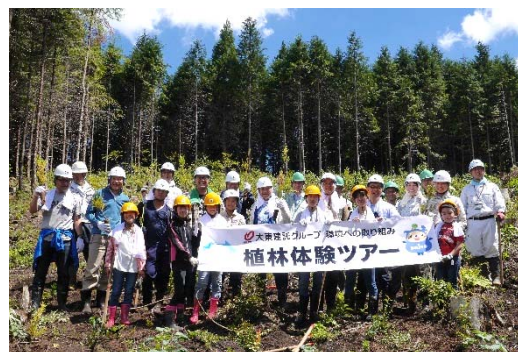
2018年8月25日に開催した植林体験ツアーの様子

参加した19名は、大分県玖珠郡九重町の杉林に約400本の杉の苗木を植林しました。また、大分県職員の方より「木を使うことで地球がよくなるお話」を伺い、伐採現場を間近で見学するなど、木の環境への役割を学び、森と木に触れ合う貴重な体験となりました。