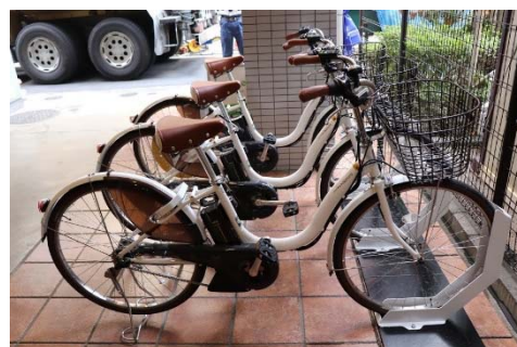
ステーションの設置イメージ