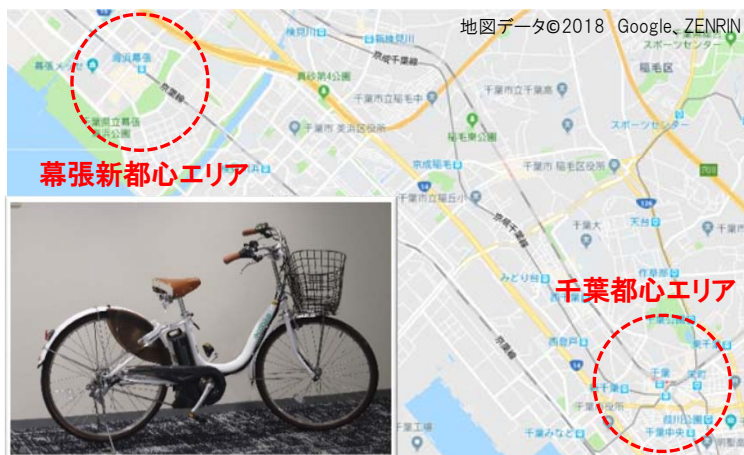
設置される電動自転車