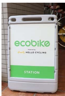
ステーションの目印

車の使用を低減することによるCO 2 排出量の削減や市街地の混雑緩和など、様々なメリットがあります。