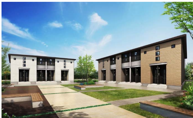
左:4戸並(北入)、右:5戸並(北入)