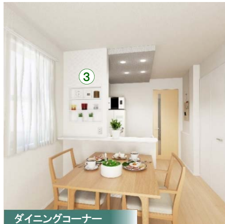
ダイニングコーナー