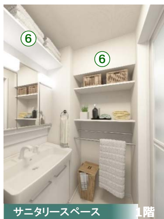
サニタリースペース 1階