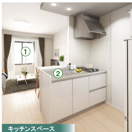
キッチンスペース

キッチンには、2口ガスコンロ付きのオリジナルシステムキッチン(標準仕様)、サニタリーには、メイクや身支度に便利な三面鏡洗髪洗面化粧台(標準仕様)といったワンランク上の住宅設備を導入。また、セレクトフックやアクセントニッチといった“自分らしさ”をアレンジできる「わたしのカタチアイテム」を標準で採用しています。