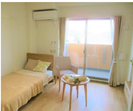
居室内(モデルルーム)の様子