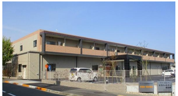
「エルダーガーデン南つくし野」外観

本住宅は、東急田園都市線「すずかけ台駅」から徒歩3分と駅から近く、近隣に公園もある緑豊かな環境です。一般的な賃貸住宅と同様の自立した暮らしが可能となるサービス付き高齢者向け住宅を開設し、高齢者が住み慣れた地域で安心して暮らせるまちづくりに貢献していきます。