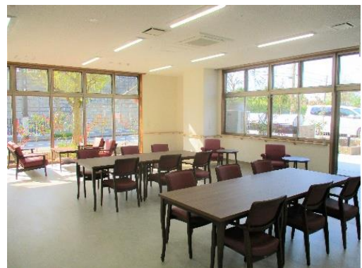
ラウンジスペース