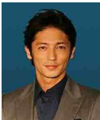
玉木宏（たまき ひろし）さん 1980年1月14日生まれ 愛知県出身