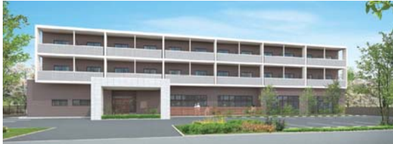
●RC造 デイサービス併設プラン(外観)