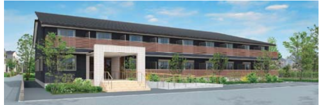
●木造2×4工法 全住戸プラン(外観)