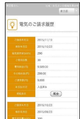
電気請求履歴 イメージ