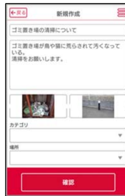
写真とメッセージを投稿

また、アプリ上で管理会社とやり取りすることができるようになり、電話だけでは伝わりにくい相談も写真を添付することでより正確に伝えることができます。