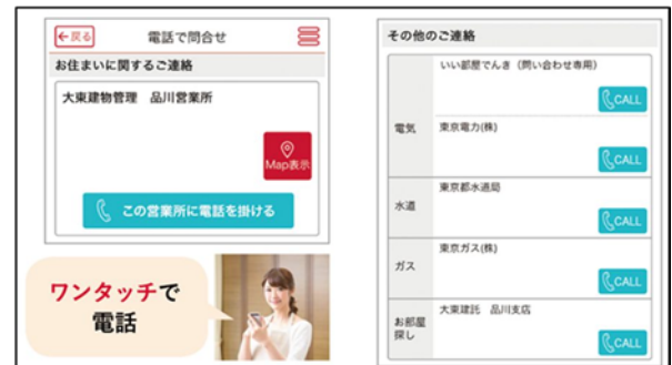
問い合わせ画面 イメージ

お住まいの建物を管轄する管理会社をはじめ、水道・ガス・電気など、各種窓口の連絡先を一括登録。この画面から、直接電話の発信が可能です。いざという時、連絡先が見つからずに慌てることがなくなります。