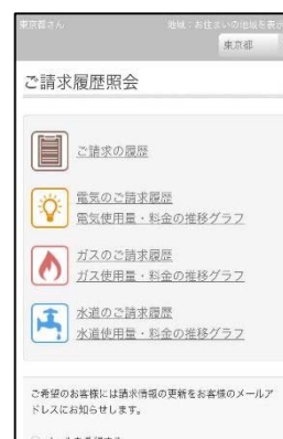
請求一覧 イメージ