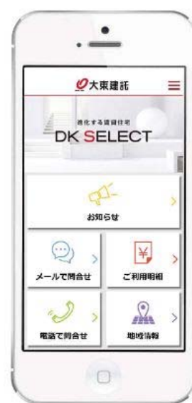
【「DK SELECT 進化する暮らしアプリ」のTOP画面】